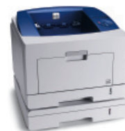
Drukarka Phaser 3435 z opcjonalnym zasobnikiem 2